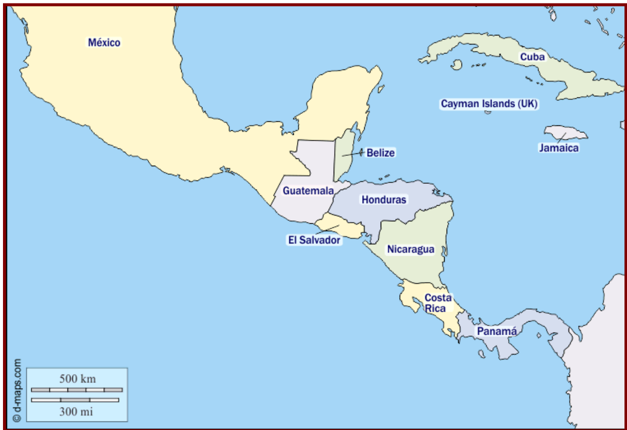
Carte de l'Amérique centrale

Néanmoins, les parcours de ces petits pays se caractérisent historiquement par une pauvreté structurelle, une forte dépendance aux contextes internationaux et une fragilité institutionnelle autoentretenu par la corruption. Dès lors, le sort de l'Amérique centrale se joue : politiquement selon les désirs du puissant voisin américain (dans le cadre de la doctrine Monroe) ; économiquement selon la volonté des pays du nord à absorber leur production agricole (principalement bananes, sucre et café), industrielle (par les maquilas , usines à bas salaires et exonérées fiscalement où sont fabriqués en général des vêtements pour l'exportation) et aujourd'hui de services de sous-traitance depuis les zones franches ; socialement selon les défaillances des États dysfonctionnels et la pénétration des réseaux mafieux, en particulier liés au marché de la drogue.