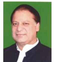
Nawaz Sharif ancien 1er min. leader du PML-N opposant à Musharraf