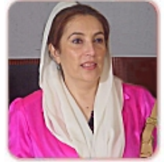
Benazir Bhutto ancienne 1er. Ministre leader de l'opposition prochaine 1er Min. ?

Une pléiade d'acteurs aux desseins divers