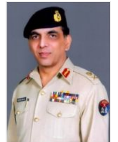
Général Pervez Kyani n°2 de l'armée prochain n°1 ? successeur de Musharraf ?