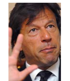
Imran Khan icône du sport national homme politique critique de Musharraf brièvement arrêté