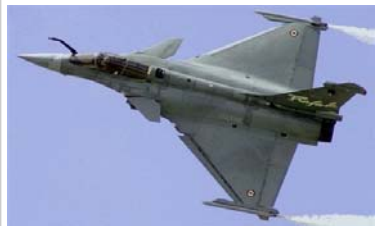
Le Rafale , bientôt dans l'Indian Air Force : un succès à l'export historique pour Dassault.