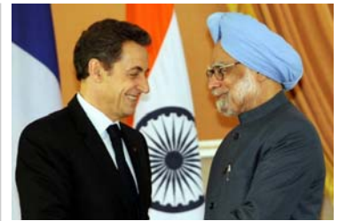
Discussion Président N. Sarkozy - 1 er ministre M. Singh, Inde, décembre 2010.