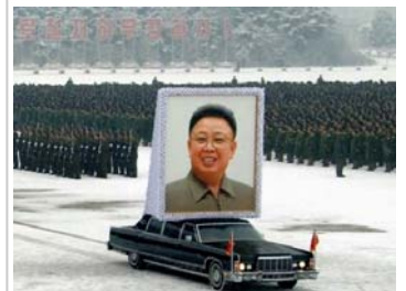
Kim Jong-un , le Grand héritier , ou la permanence du joug dynastique de la famille Kim à Pyongyang