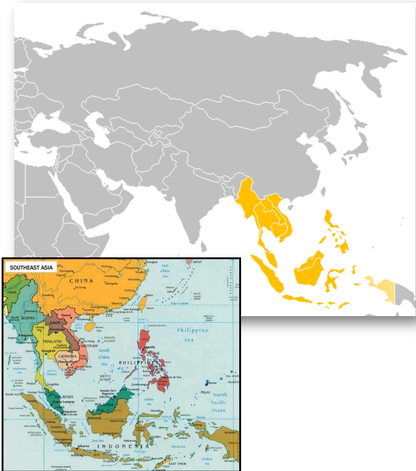
Figure 1 - L'Asie du sud-est 1