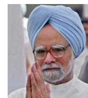
Dr Manmohan Singh

né en 1932 ... dans l'actuel Pakistan 17 ème Premier ministre indien - en fonction depuis mai 2004 - économiste de formation - parti du Congrès.