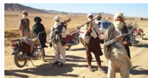
Du nord au sud, les talibans, toujours plus présents, déterminés et dangereux.