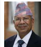
M. Kumar Nepal Communiste 57 ans 1er min. depuis mai 2009 (le 18e depuis 1990...)