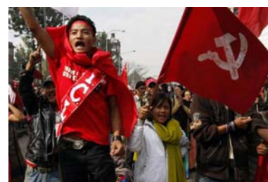
Slogans et menaces : manifestants maoïstes dans les rues de Katmandou, (début mai 2010).

1996 : début de l'insurrection maoïste. 2001 : massacre de la famille royale. 2001 : intensification des combats ; proclamation de l'état d'urgence. 2005 fév. : retour de la monarchie absolue face au péril maoïste ; état d'urgence. 2005 nov. : accord maoïstes/partis politiques pour rétablir la démocratie. 2006 avr. : le roi rétablit le Parlement. 2006 mai : Parlement limite les pouvoirs du roi ; pourparlers paix avec maoïstes. 2006 nov. : accord de paix ; mise en place d'un gouvernement intérimaire. 2007 : violence ethnique dans le sud-est. 2007 avr. : maoïstes au gouv. intérimaire 2007 déc. : abolition de la monarchie. 2008 janv. : le Terai (sud) réclame une autonomie régionale ; violence. 2008 avr. : élections constituintes ; les maoïstes obtiennent le plus de sièges. 2008 mai : Népal devient une République 2008 août : Prachanda, leader maoïste, 1er min. d'un gouvernement de coalition. 2009 mai : démission de Prachanda ; Madhav Kumar Nepal devient 1er min. 2010 2 mai : début grève générale décrétée par les maoïstes ; pays paralysé. 2010 28 mai : date butoir des travaux de l'Assemblée Constituante.