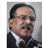
P. Kamal Dahal, dit Prachanda Leader maoïste 56 ans 1er min. entre août 2008 et mai 2009