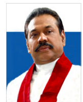
Mahinda Rajapaksa (65 ans ; réélu), 40 années de carrière politique, lauréat du 1 er scrutin de « l'après-guerre ».