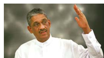
L'ex général Sarath Fonseka (60 ans ; ancien chef des armées), grand vaincu du scrutin de 2010.